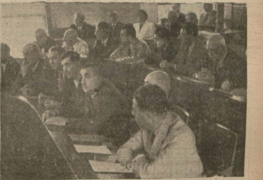
Dünkü Şehir Meclisi İhtimandan bir intiba (Yazısı 6 inci sayfa)