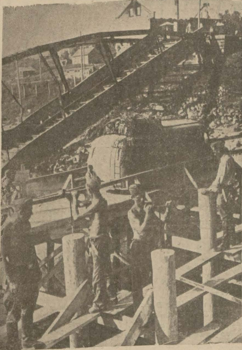
Alman askerleri garb cephesinde muvakkat bir köprü kurarlarken

Vaşington 2 (A.A.) — Roysterin aldığı habere göre Reischimbur Ruzvelt tarafından dün irad edilen nutuk vesilesiyle mahrumiyetini arttırmaya gayret etmektedir. Bu şekilde bu şifarda Amerikalıların birçok şeylerden mahrum olabilecekleri keyfiyetini hazırlamakta idi.